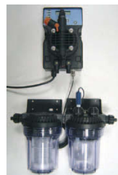
> Panel regulador/controlador de pH

DLXCL/M: Bomba con regulador y controlador de conductividad.